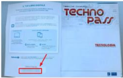
All'interno della copertina, libro dello studente

Ecco dove potete recuperare il codice di attivazione dei Libri digitali (i codici sono stati oscurati):