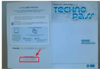
All'interno della copertina, guida per il docente